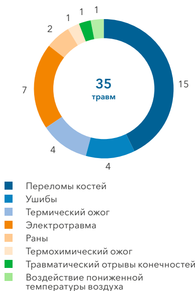
Количество и типы полученных травм в 2021 году